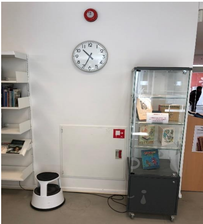
Faglitteratur 30'erne: brandslange